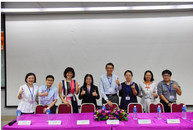
圖說：《高齡社會的政策願景與革新論壇》第二場健康老化政策與心理健康：講師群