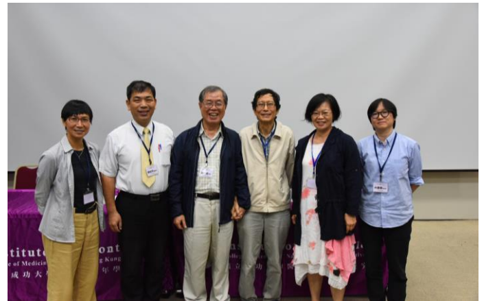
圖說：《高齡社會的多元服務與創新論壇》第二場老化社會實務-居住與環境：講師群