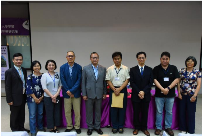
圖說：《高齡社會的多元服務與創新論壇》第一場高齡社會的多元需求、服務創新與人才培育：講師群