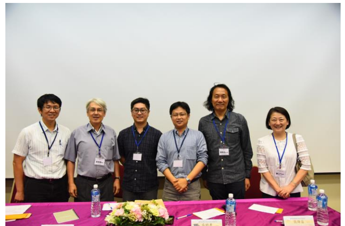
圖說：《高齡社會的政策願景與革新論壇》第三場人口老化議題與經濟安全之社會政策：講師群