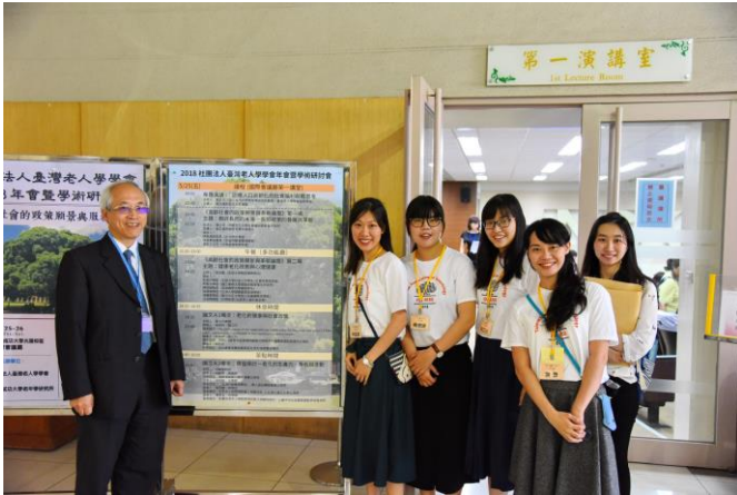
圖說：學生志工與所長