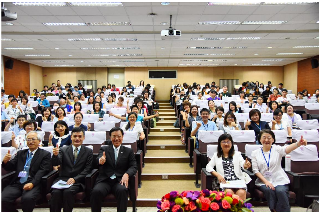
圖說：開幕式與會者大合照