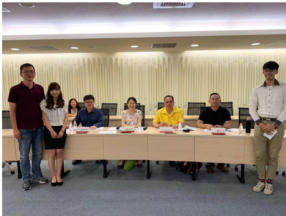
4/25 當日賽後場景·隊友及評審

Creativity takes courage - Henri Matisse